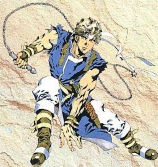
ILLUSTRATION by AKIHIRO YAMADA

「悪魔城ドラキュラXX™」 is an original game developed by KONAMI CO.,LTD. KONAMI CO.,LTD. reserved all the copyrights, trademarks and other industrial property rights with respect to this game.